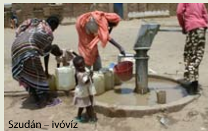
Szudán – ivóvíz